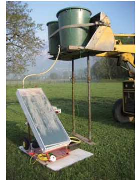
Prototype 2 en fonctionnement sur banc d'essai