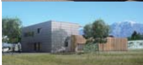
Ouverture en septembre 2010 de la Cuisine Centrale (SCI L'ATELIER ROCHOIS), investissement 1 500 K€.