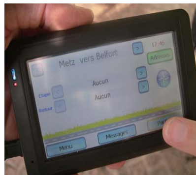
Validation d'un trajet d'un passager sur le boîtier.