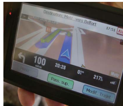
Ecran de navigation pour un conducteur.

Responsabilités, Disponibilité du service, Inscriptions, Mineurs, Comportement des utilisateurs sur le site internet et au travers des modes de communication mis à disposition, Déclaration d'un trajet, Horaires, Organisation des équipages de covoiturage, Animaux et bagages, Rôle de chacun, Engagement des passagers, Engagement des conducteurs, Assurance, Itinéraires, Participation aux frais, Période d'essai et préavis de désengagement, Conservation des données et Informatique et liberté.